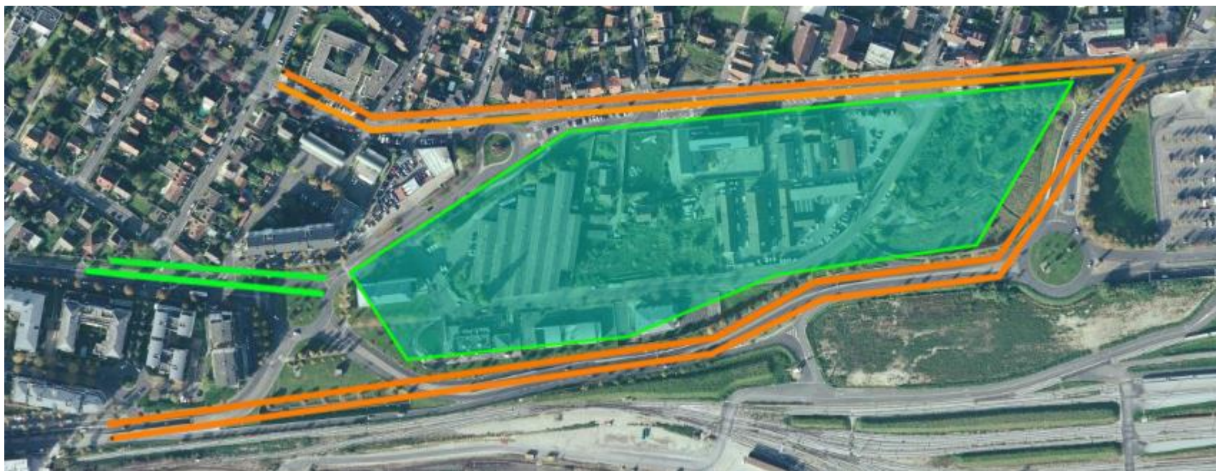
Figure 3 : hiérarchisation proposée des rues autour du secteur Castermant

Une ouverture vers l'est de la partie de l'avenue du Gendarme Castermant amènerait à repenser la hiérarchisation des rues selon la figure 3 : deux voies principales, en orange, encadrant le secteur Castermant supportant la circulation générale, et une voie secondaire, en vert, dédiée aux circulations douces, d'où seraient exclues les circulations de transit.