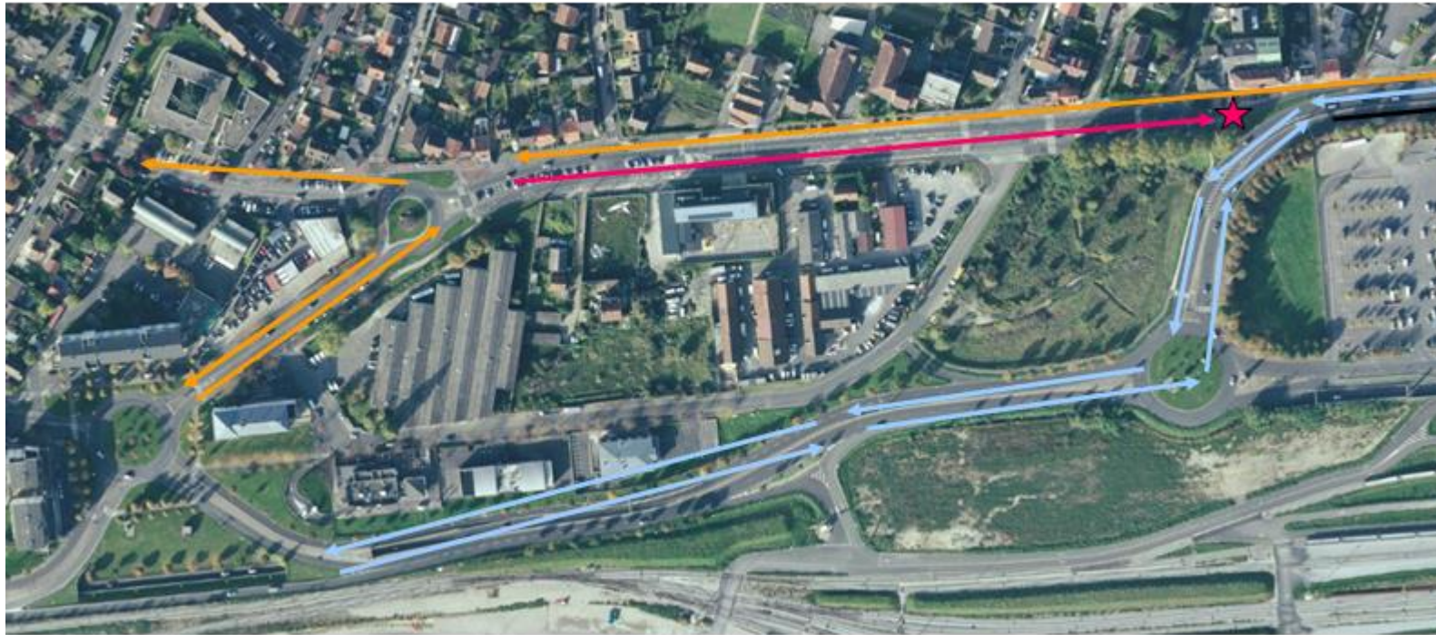
Figure 2 : les flux de circulation autour du secteur Castermant

La figure 2 illustre cette situation en soulignant les différents flux. En bleu, le flux « naturel », à double sens de et vers le centre-gare et le sud de la ville (vers Gagny à l'ouest, pour le centre-gare) ; en orange, les flux « contrariés », depuis l'accès difficile à l'Est vers le centre-ville via Gambetta et l'ouest de la ville et au-delà vers Montfermeil, ainsi que vers le nord via l'avenue François Trinquand, ; en rouge, le flux en impasse vers l'Est.