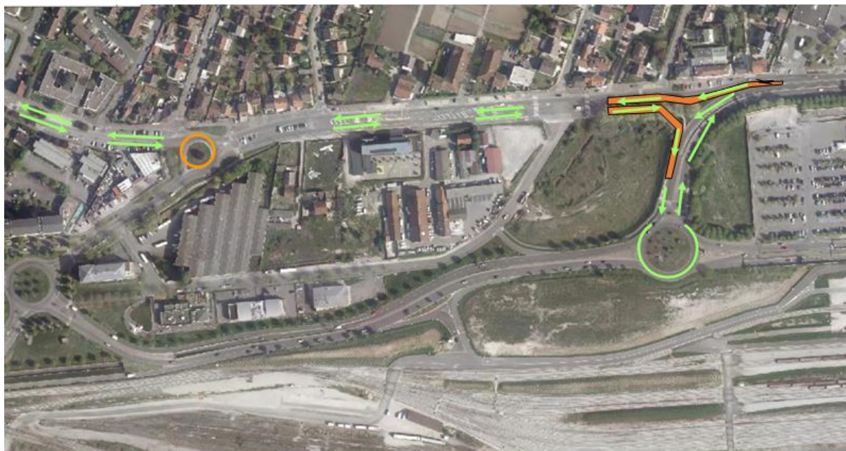
Figure 4 : solution transitoire proposée pour une issue « Est » de l'avenue du Gendarme Castermant

Une déviation est créée entre l'extrémité est de la section de la section de l'avenue Castermant concernée, ouvrant la voie « sud » du futur boulevard urbain sur la déviation de l'ex RN34 et permettant de rejoindre la continuité de l'avenue du Gendarme Castermant en remontant après avoir emprunté le giratoire desservant le parking aérien bas du centre commercial Terre-Ciel.